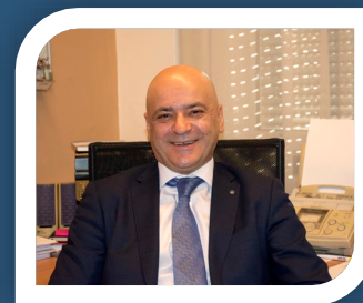
3. Prim.dr. Goran Čerkez, pomoćnik ministra za za javno zdravlje, Federalno ministarstvo zdravstva Zaključna razmatranja povodom pandemije covid-19

Odgovori na krizu izazvanu pandemijom covid – 19 u Kantonu Sarajevo