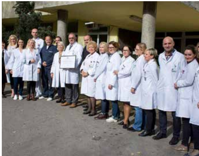
Potvrđena reakreditacija JU Psihijatrijska bolnica KS

ni) nivo kvaliteta, nema više prostora za grešku. Naravno ako želite ostati tu gdje ste stigli. Od tog trenutka dalje, obaveza stalno otvorenog revizijskog ciklusa postala je vaš način rada, način razmišljanja i objektivna – potreba. Usvajanje principa jačanja sistema kvaliteta nije više stvar izbora i opcije nego jedine opcije. To je jedini način rada i jedina praksa.