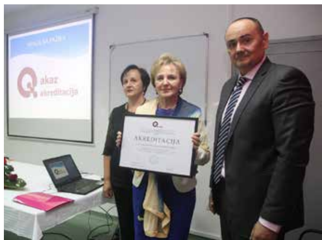
Zavodu za bolesti ovisnosti KS dodijeljena akreditacija za uspostavljen sistem kvaliteta