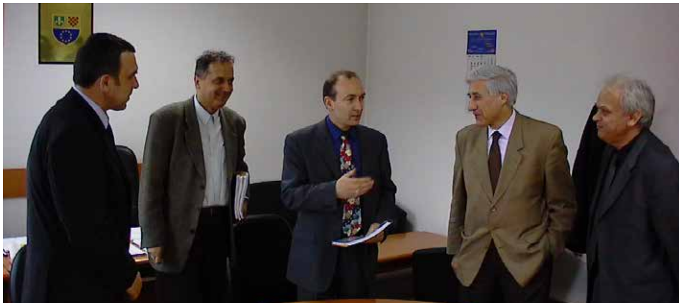
Osnivanje AKAZ-a kroz Projekat Svjetske Banke, Sarajevo 09.04.2003.

rješavanja pojedinih specifičnih problematika u vezi nekih grupa pacijenata, bilo da smo uzimali učešće u projektima koji su komplementarni našim sistemskim zadacima a općenito poboljšavaju preduslove za uvođenje i podizanje sistema sigurnosti i kvaliteta u zdravstvu.