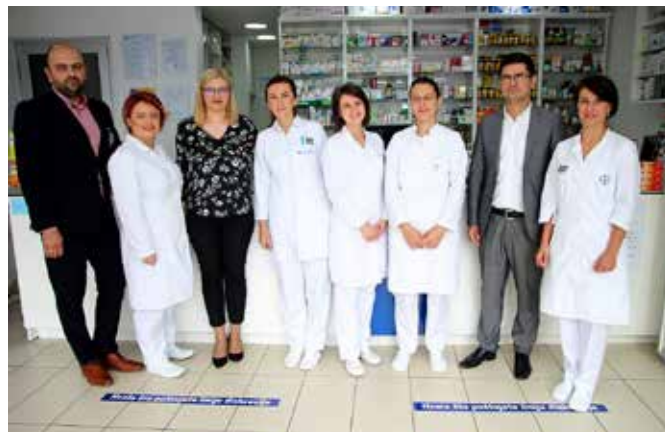
PZU Apoteke "Oaza zdravlja"

Također, dodijeljena je i certifikacija za ukupno 16 apoteka i ogranaka, od čega jednoj apoteci uslovna certifikacija, lancima apoteka PZU Apoteka „Al Hana“ Sarajevo, PZU Apoteka „Diva Medica“ Goražde, PZU Apoteka „MEDIFLOR“ Živinice i PZU Apoteka „Oaza Zdravlja“.